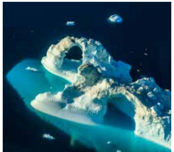
FOTOGRAF — Greenland Glacier Camp