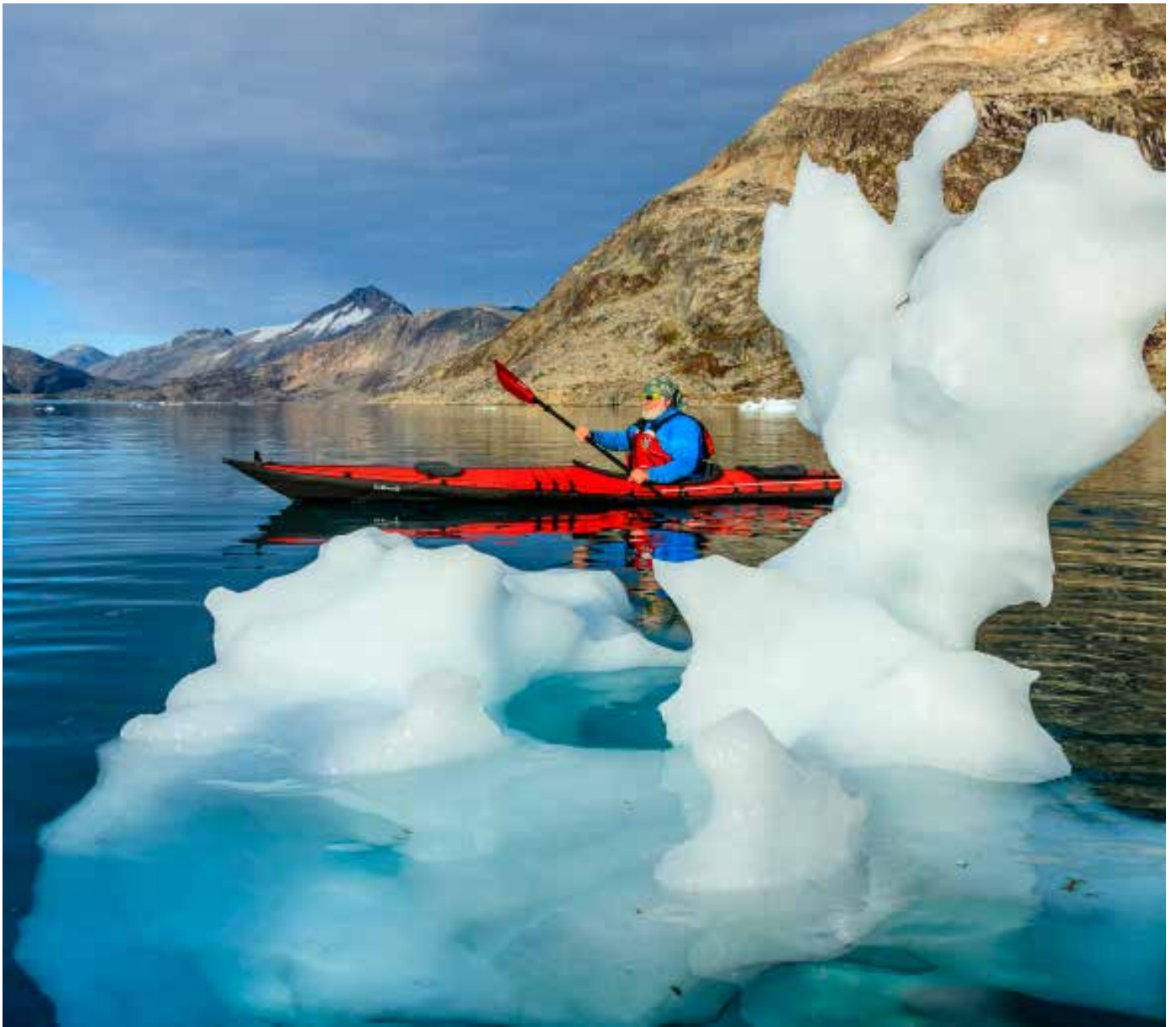
FOTOGRAF — Greenland Glacier Camp